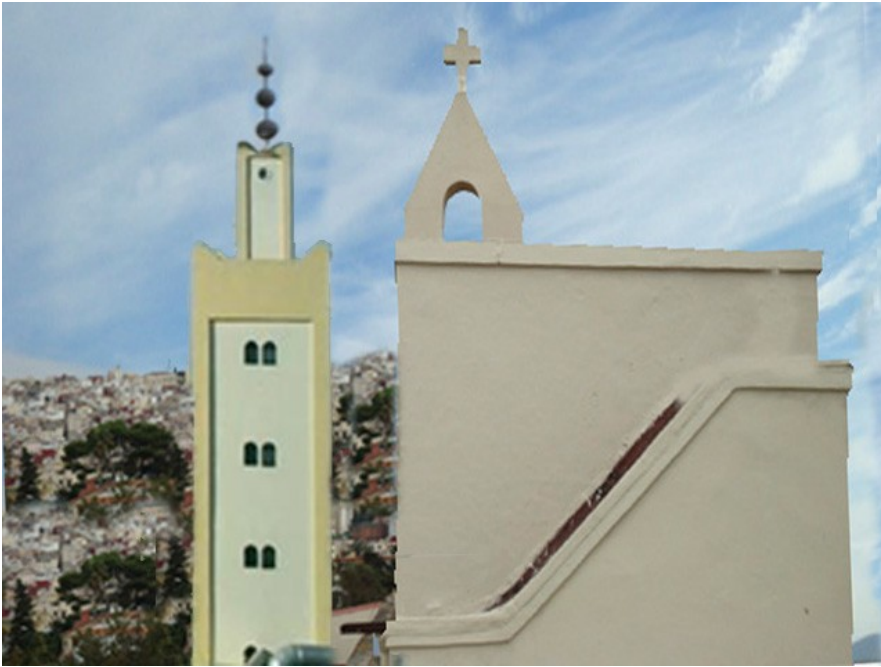
La cruz de nuestra ermita y el minarete de la mezquita vecina

“Me es especialmente grato testimoniar cómo los lazos que unen a todos aquellos que creen en Dios han sido fortalecidos en los años recientes. Estoy agradecido particularmente por los vínculos de diálogo y confianza que han sido forjados entre la Iglesia católica y el Islam. Por medio del diálogo hemos llegado a ver más claro los muchos valores, prácticas y enseñanzas que aúnan nuestras dos tradiciones religiosas: por ejemplo, nuestra creencia en el Dios único, omnipotente y misericordioso, creador de cielos y tierra, y la importancia que damos a la oración, la caridad y el ayuno”.