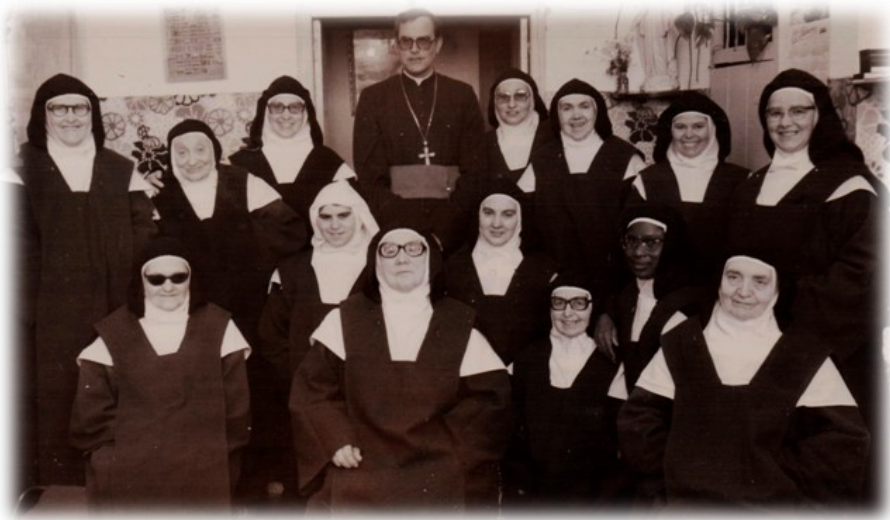
Comunidad en los años 80