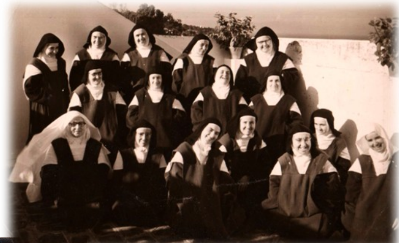
Comunidad en los años 50