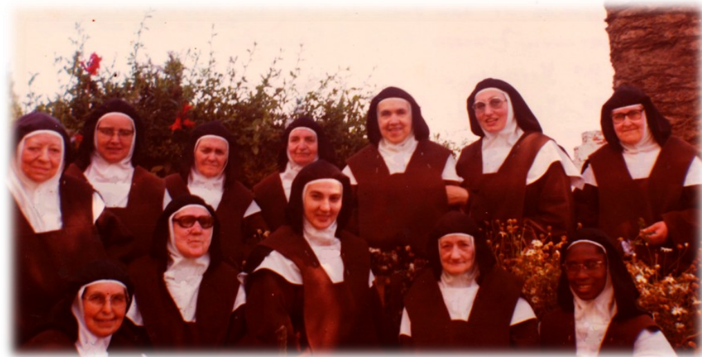
Comunidad en los años 70